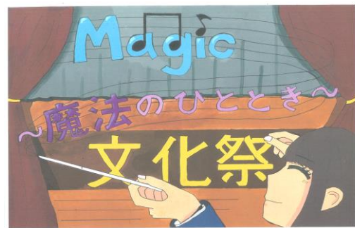
美術部2年 中村 結愛