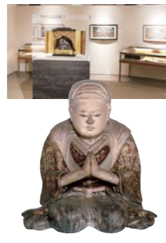
二位尼像(清盛の妻)