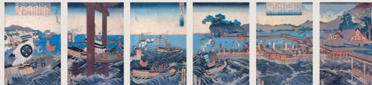
歌川貞秀「厳島合戦図」

広島県廿日市市宮島町57番地 TEL (0829) 44-2019 FAX (0829) 44-0631