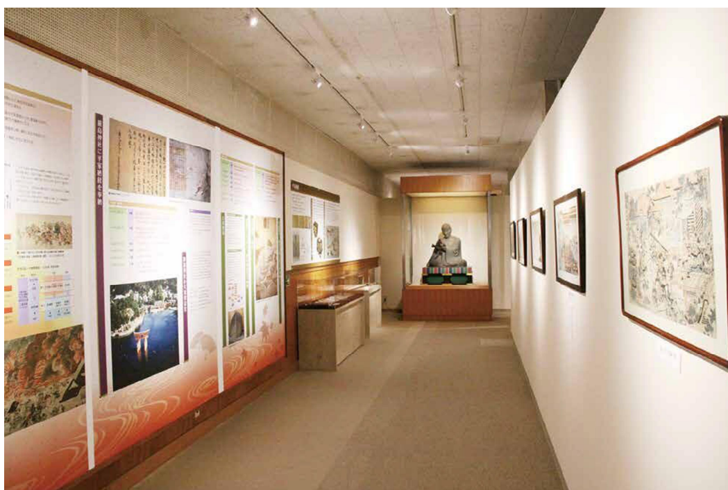
D 展廳 一樓展品

一樓展覽的主角是嚴島神社和平安時代（794-1185）重要的權臣平清盛（1118-1181）。平清盛在宮島的對外文化交流中起到了很關鍵的作用，他將京都的貴族文化引入宮島，同時又大幅提升了嚴島神社在京都上流社會的地位。廳內有段影片詳細描述了平清盛的功績與宮島戲劇性的歷史，配有英文字幕。其他展品則介紹了《平家物語》中與宮島有關的歷史事件。《平家物語》講述 12 世紀晚期平清盛所屬的平家與敵對家族源氏之間的爭霸故事，是一部宏大的軍記物語。