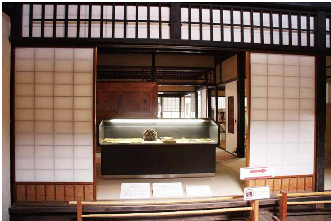
保存民家（舊江上家主屋）