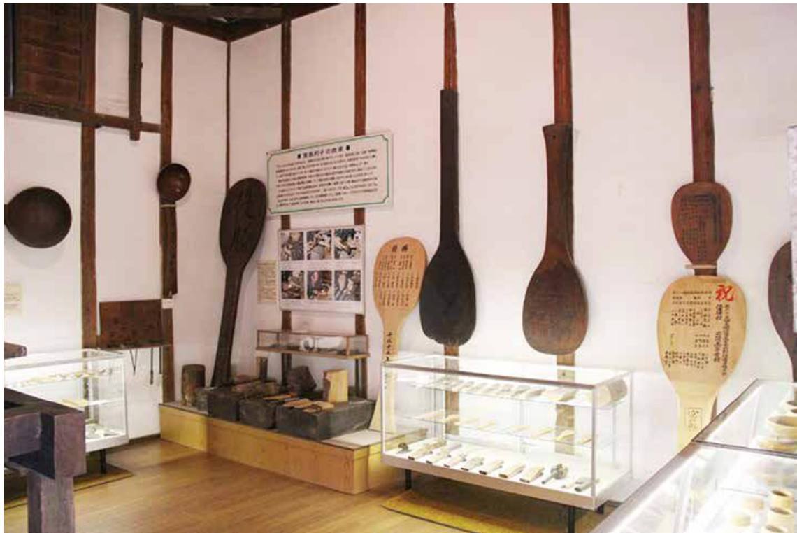
C 展廳 木工工藝相關的藏品

展出的木工製品包括用來攪拌或盛舀米飯的木勺以及各式各樣的托盤，餐具等，其中一些還刻有精美的紋飾。據說飯勺於 18 世紀晚期在宮島發明，如今早已成為全日本普遍使用的餐具。展品中還有大號木勺，通常被當作當地特產和伴手禮。遊客除了欣賞工藝品，還可以從展廳內的傳統陶藝轉盤等多種工具中，了解宮島木工的作業流程。