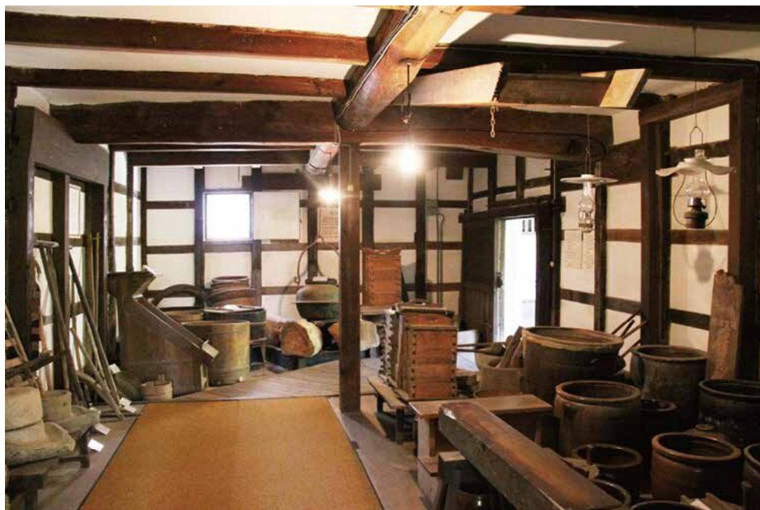
A 展廳 日常生活的用具

鋸子是當年當地伐木工人使用的工具。在江戶時代（1603-1868），宮島上大部分的森林都屬於廣島藩大名（大領主），大多數樹木都嚴禁百姓砍伐，因此工人必須十分小心地避免誤伐樹木。而今天，雖然也禁止砍伐樹木，原因卻全然不同了——宮島全島都已被劃入「瀨戶內海國立公園」以及「特別史跡及特別名勝嚴島」的範圍。此外，整個宮島還被聯合國教科文組織（UNESCO）列為世界遺產，其中，嚴島神社，彌山原始森林等區域是核心區，町家（商人或工匠的住宅群）等區域則是緩衝區。在所有展品中，農具數量明顯比鋸子少，這是因為宮島本身被視為神明棲居之地，明治時代（1868-1912）以前，宮島一直嚴禁務農。即便在 19 世紀晚期，延續了數世紀的禁令終於被解除後，宮島的農業也未能真正發展起來。而零星開墾的土地還會遭到鹿群和野豬的破壞，這也讓農民望而卻步。