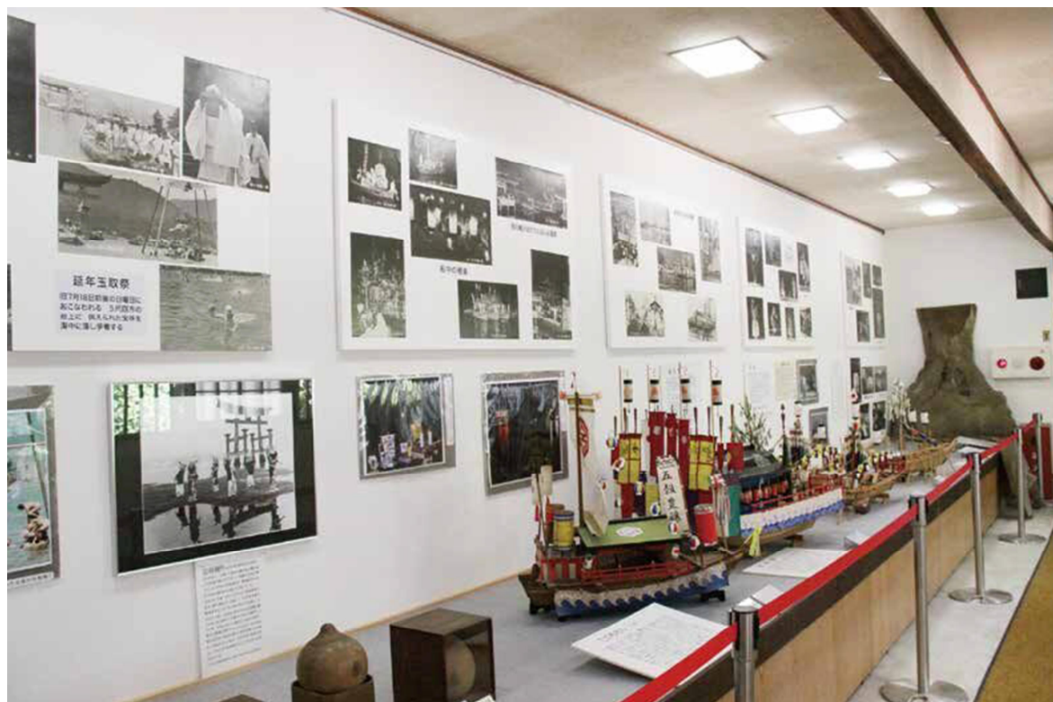
B 展廳 民俗活動

在秋天舉行的民俗活動「たのもさん」(Tanomo-san) 中，船隻也很重要，尺寸卻小得多。過去，宮島人長期被禁止務農，人們就製作小船向為他們提供糧食的本州農民表達感謝。這些小船先在四宮神社接受祝禱，掛上小燈籠，然後在天黑後，從嚴島神社放流入海，勾勒出星星點點隨波蕩漾的夢幻美景。