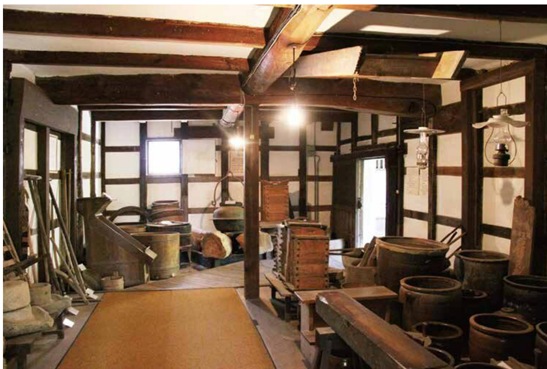
A 展厅 日常生活的用具

锯子是当年本地伐木工人使用的工具。在江户时代（1603-1868），工人必须十分小心地避免误伐树木。当时，宫岛上大部分的森林都属于广岛藩大名（大领主），因此岛上大多数树木都严禁百姓砍伐。如今虽也禁止砍伐，只是原因不同了——宫岛全岛都已被划入“濑户内海国立公园”以及“特别史迹及特别名胜严岛”的范围。此外，整个宫岛也已被联合国教科文组织（UNESCO）列为世界遗产，其中严岛神社，弥山原始森林等区域是核心区，町家（商人或工匠的住宅群）等区域则是缓冲区。展品中的农具数量比锯子少，这是因为宫岛本身被视为神明栖居之地，在明治时代（1868-1912）以前一直严禁务农。即便延续了数世纪的禁令在 19 世纪晚期被解除，岛上的农业也未能真正发展起来，而零星开垦的土地常会遭到鹿群和野猪的破坏，这也令农民望而却步。