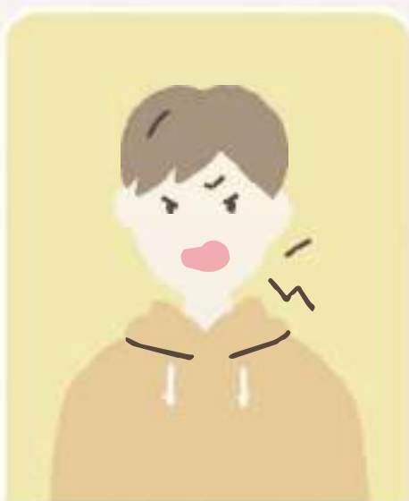
怒りやすくなった