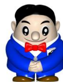
広島国税局キャラクター 広島主税(ちから)くん