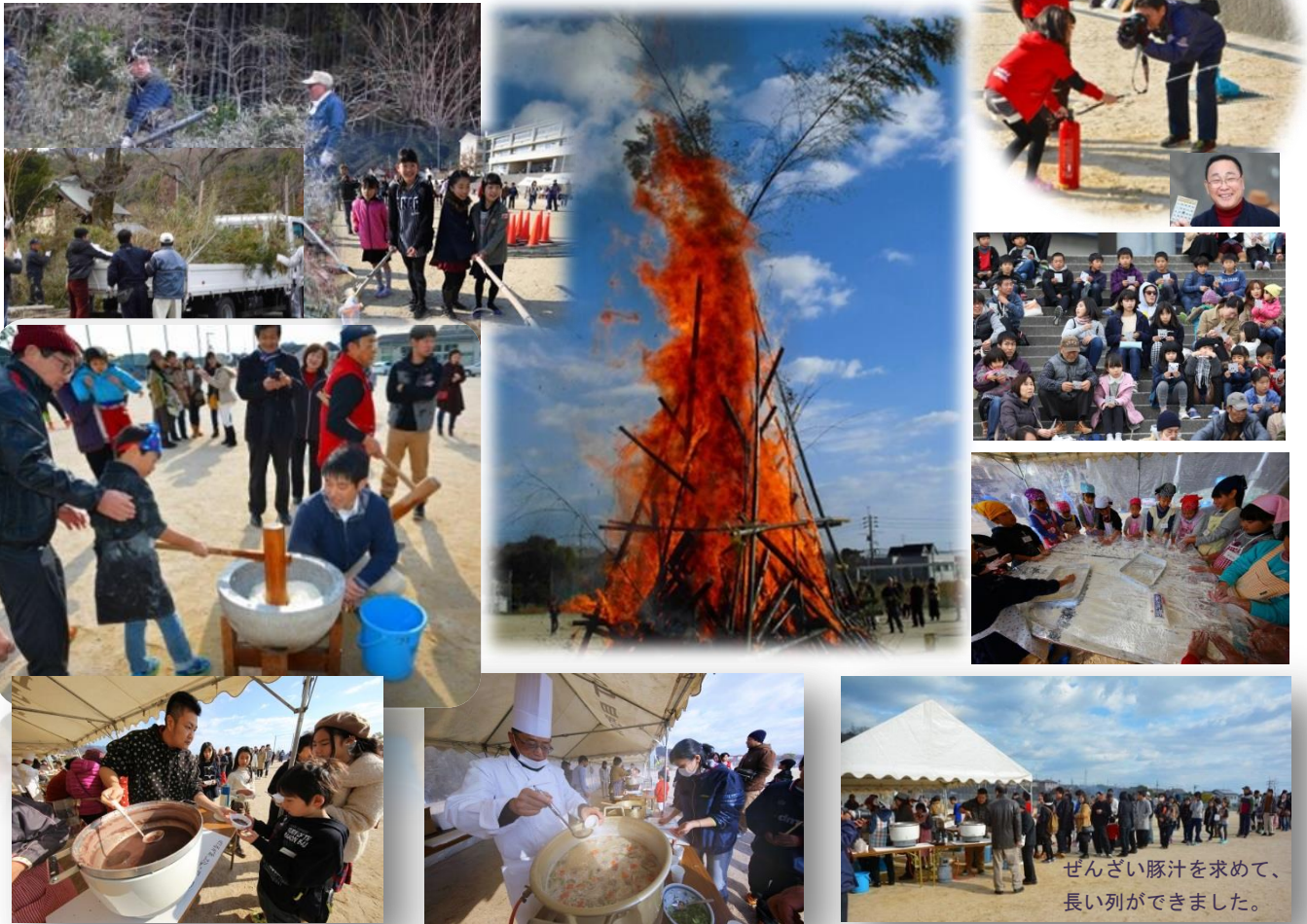
ぜんざい豚汁を求めて、長い列ができました。

歓声がグラウンドに響くほど炎が高く上がって、「やぐら」の近くにいた人達は、自然と後ずさりするほどでした。火にあたった後は、豚汁、つくたての餅を入れたぜんざいに舌ずつみを打ち、ビンゴゲームで一喜一憂し、今年も楽しいひと時が流れていました。こんなひと時を提供していただいた、コミュニティ役員、町内会の方々に感謝です。